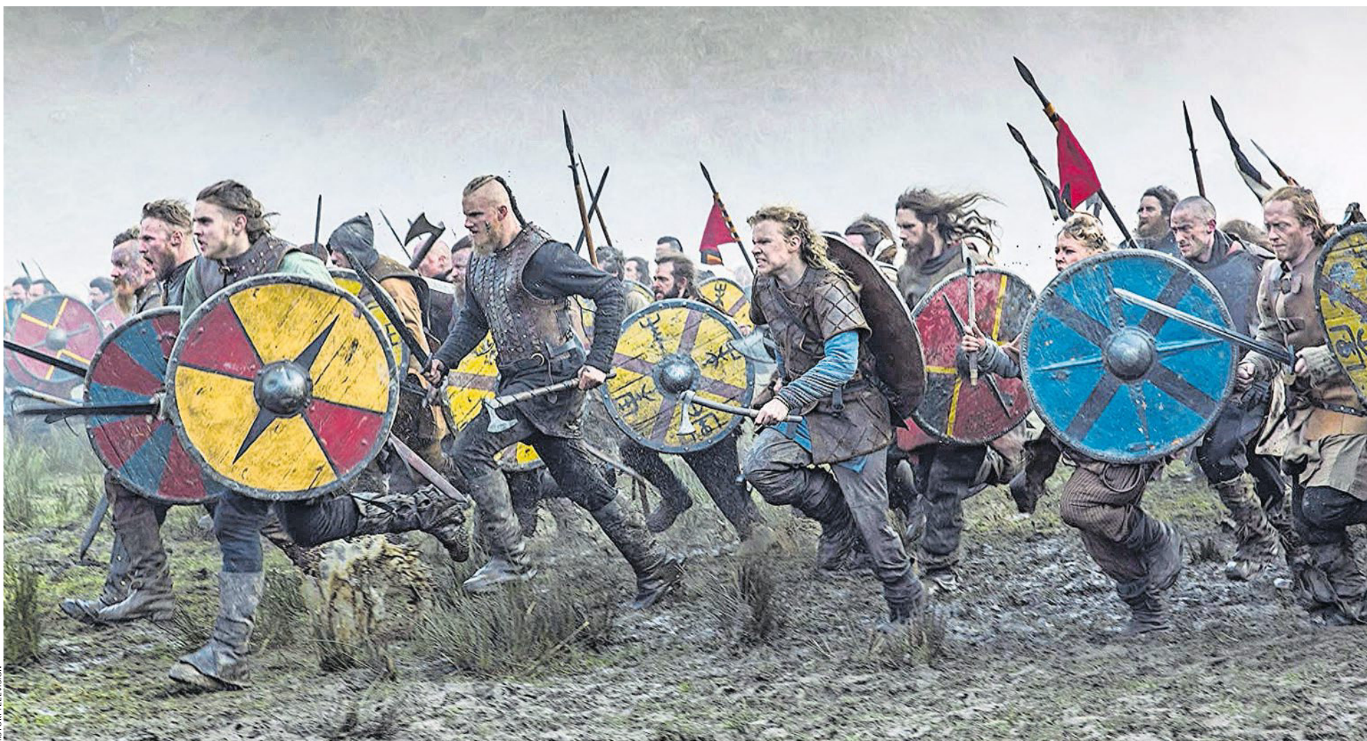
Plündern als Geschäftsmodell: Wikinger in der Fernsehserie «Vikings» (2013).

Sparsam Ein neuer Motor senkt den Benzinverbrauch um bis zu 20 Prozent 53