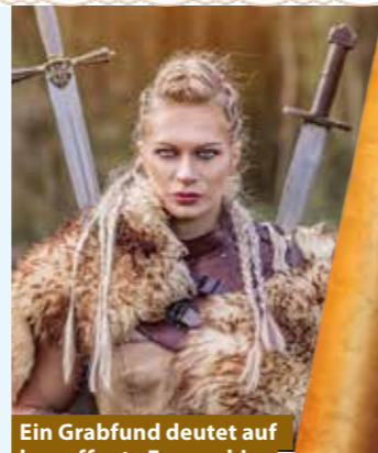
Ein Grabfund deutet auf bewaffnete Frauen hin