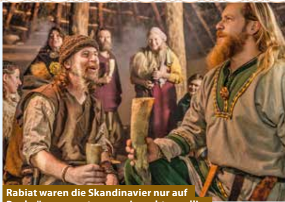
Rabiat waren die Skandinavier nur auf Raubzügen, sonst waren sie recht gesellig