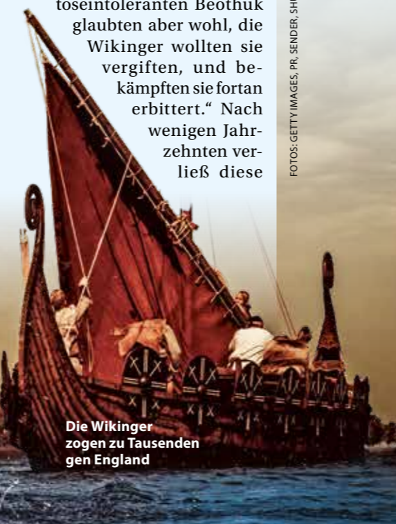
Die Wikinger zogen zu Tausenden gen England

vische Gefolgschaften waren sie schon viel früher immer wieder mal losgezogen, um Handel zu treiben, aber vor allem, um schnelle Beute zu machen“, legt Matthias Toplak dar. „Ihr Weg führte sie dabei immer wieder auf die Britischen Inseln, sie besiedelten schließlich Island und Grönland und landeten von dort aus Anfang des 11. Jahrhunderts als erste Europäer an der kanadischen Küste.“ Dort gründeten die ausgezeichneten Seefahrer eine zeitweilige Niederlassung und versorgten sich in den Wäldern mit Holz für ihre schnellen Langschiffe. „Die Wikinger hatten Rinder mitgebracht und boten den Indigenen zum Tausch gegen Felle Milch an“, erzählt Matthias Toplak. „Die laktoseintoleranten Beothuk glaubten aber wohl, die Wikinger wollten sie vergiften, und bekämpften sie fortan erbittert.“ Nach wenigen Jahrzehnten verließ diese