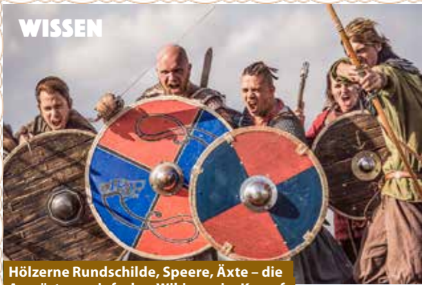
Hölzerne Rundschilder, Speere, Äxte – die Ausrüstung einfacher Wikinger im Kampf