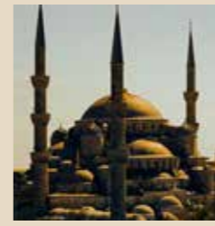
Ihre Handelsbeziehungen reichten bis nach Konstantinopel