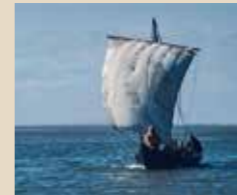
Statt Ruderkraft nutzen sie ein Rahsegel für ihre Langschiffe

„Sie zogen vor allem los, um schnelle Beute zu machen“